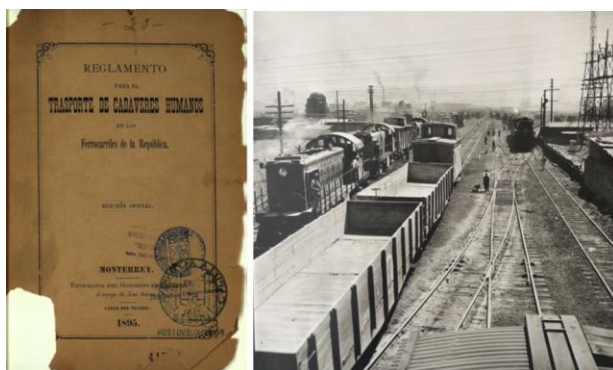
Porfirio Díaz decretó el Reglamento al que se sujetaron las personas y las empresas que dieran el servicio de traslado de cadáveres humanos por los ferrocarriles de la República.

En 1887, el gobierno de Porfirio Díaz publicó el “Reglamento para el Transporte de Cadáveres Humanos por los Ferrocarriles de la República”, el cual fue aplicado por la Secretaría de Fomento hasta 1891, cuando la recién creada SCOP asumió esta atribución. Organizado en tres capítulos, dicho documento estableció las condiciones y requisitos a cumplir por quienes desearan obtener un permiso de traslado de restos humanos usando las vías férreas de México.