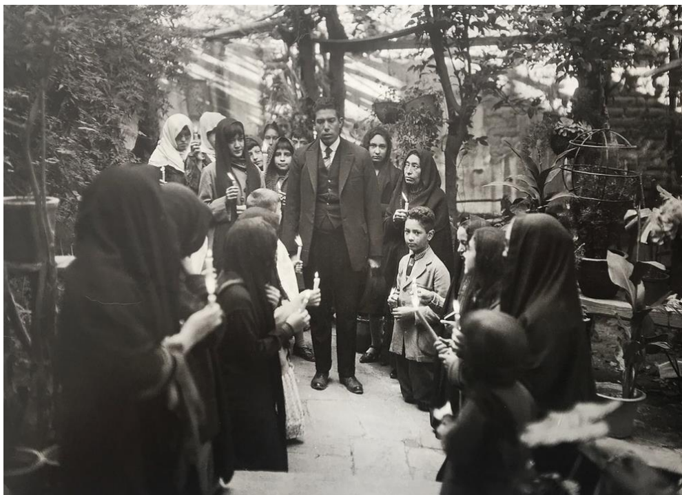
Las disposiciones sanitarias especificaron las condiciones en las que era posible preparar y trasladar un cadáver por tren.

La principal disposición del Reglamento para el Transporte de Cadáveres dictó que los restos “que se quieran trasladar en un tren de ferrocarril se colocarían dentro de una caja de zinc, plomo o fierro galvanizado, cuyas paredes tengan por lo menos tres milímetros de espesor, la cual se llenaría completamente con una mezcla en partes iguales de aserrín de madera y sulfato de zinc, o en el caso de carecer de estas sustancias, se usaría una mezcla de carbón y de cascalote.” 1